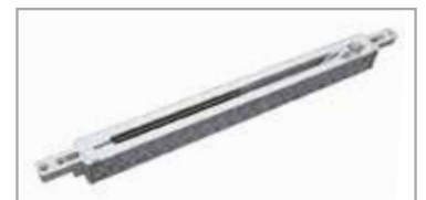
SOFT CLOSE demper (optioneel)