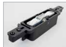
ECO SLIDE beslag (axiaal wiel)

De SOFT CLOSE demper remt de vleugel net voor zijn eindstand af en trekt deze vleugel zacht in de definitieve sluitstand. Deze demper behoedt de gebruiker voor mogelijke letsels indien het schuifraam te hard zou gesloten worden. Bovendien zorgt de demper ook voor minder slijtage bij veelvuldig gebruik.